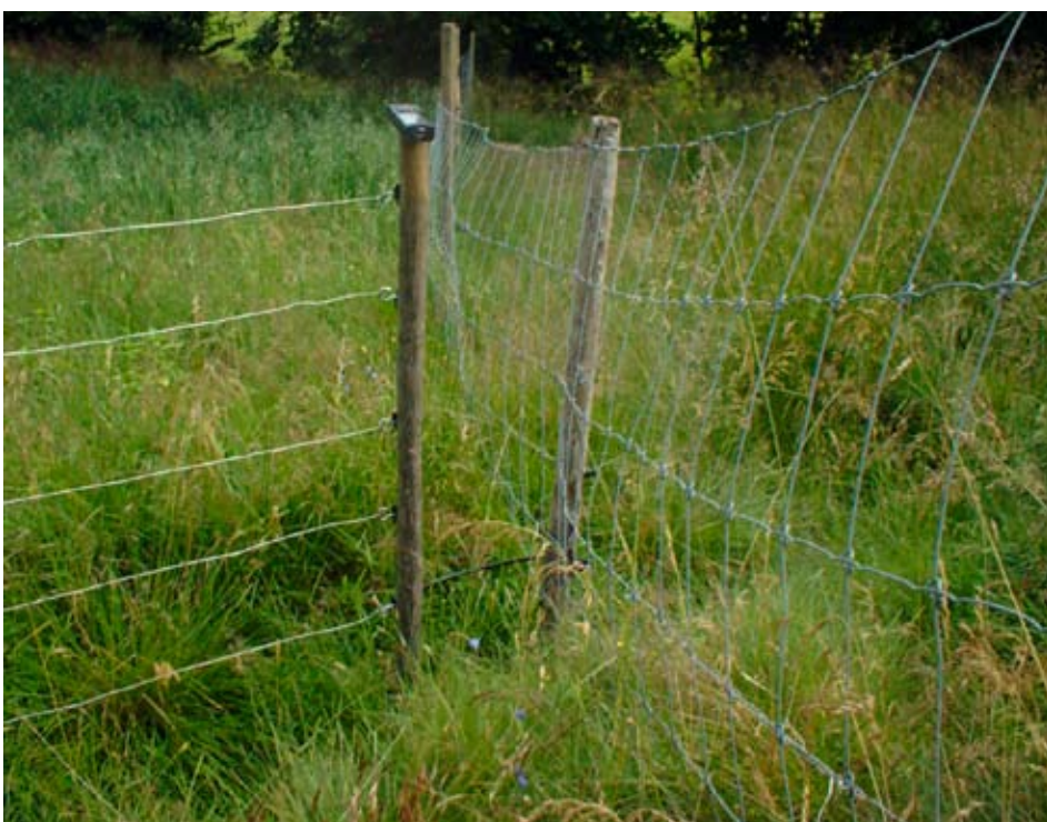
Ett exempel på en öppning/svag punkt som måste tätas.

Flera länsstyrelser har elnät med tillhörande batteriaggregat och solpanel för minst ett par hektar att låna ut