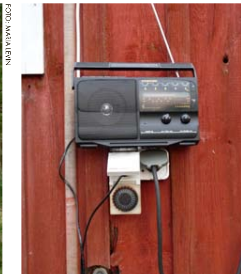
En radio kopplad till en timer.