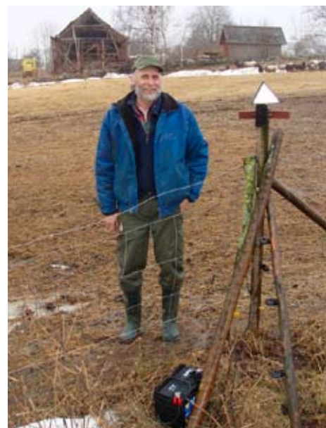
Roterande spegelprisma har använts mot örnan grepp i fårbesättningar.