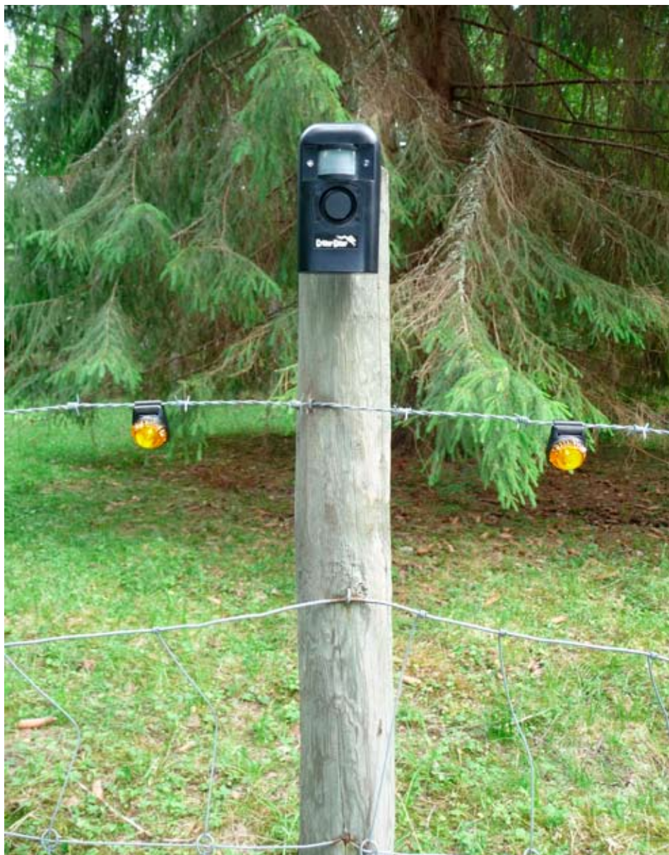
”Critter Gitter” monteras så att djurets rörelser kan registreras och aktivera ljudskrämmen. Ljusstarka lampor kan placeras ut längs stängslet.

Åtgärden kan vara en tillfällig lösning då andra åtgärder inte är möjliga, t ex för djur på fåbodbete.