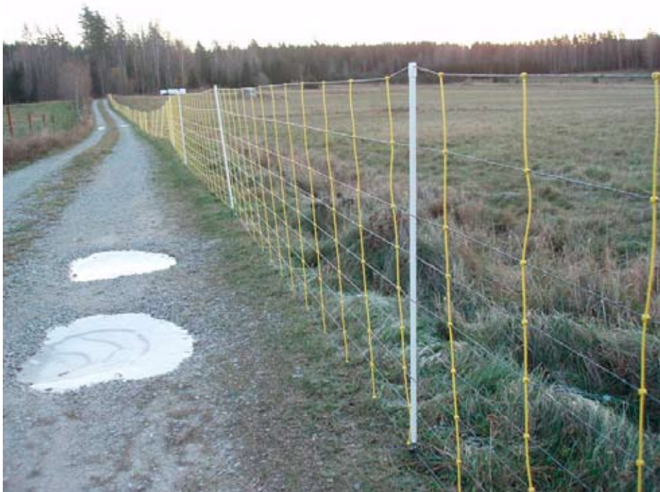
Ett elnät med styva vertikala ledare kan monteras som en akutåtgärd.

av stängslet, som underlättar för djur att ta sig in, kan stängslet behöva dras in en bit.