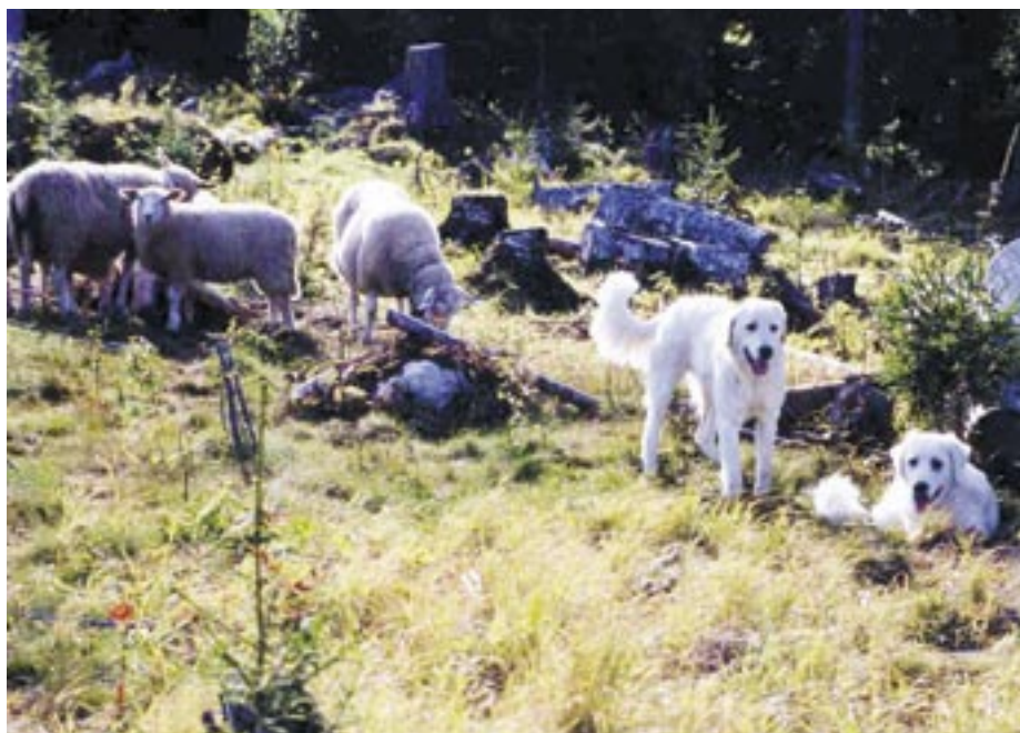
Ovan: Polski Owczarek Podhalanski.