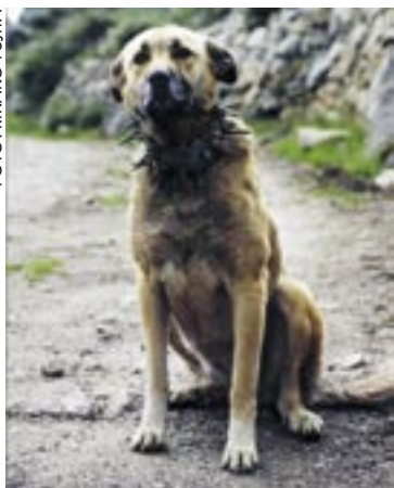
Cão da Serra da Estrela

Det finns en rad olika boskapsvaktande hundraser i världen, t ex har många länder i Europa egna inhemska raser. Bilderna visar bara några exempel på raser. Det finns även variationer i utseende inom raserna.